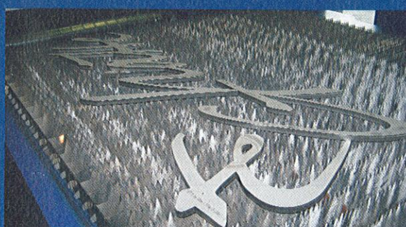
... Münchner Künstlerin ...