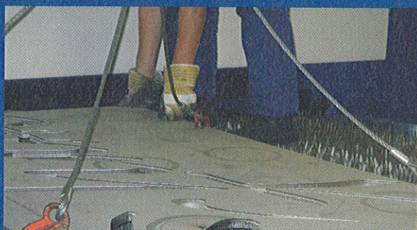
Entstehungsgeschichte eines ...

Angebot. Die Wörter werden ergangen und erfahren. Ihre innere Melodie, ihre Botschaft und ihre materielle Präsenz prägen den Ort ihres Erscheinens ebenso, wie der Ort zur Wahl dieses ganz spezifischen Textes geführt hat. Im Eingangsbereich kann man den ersten Korintherbrief des Apostels Paulus in schlichter Druckschrift entdecken – ein Angebot an alle, die mehr über diesen so persönlichen und sprechenden Text erfahren möchten. red ◇