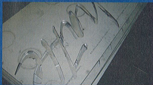
... Bibeltextes aus Metall ...