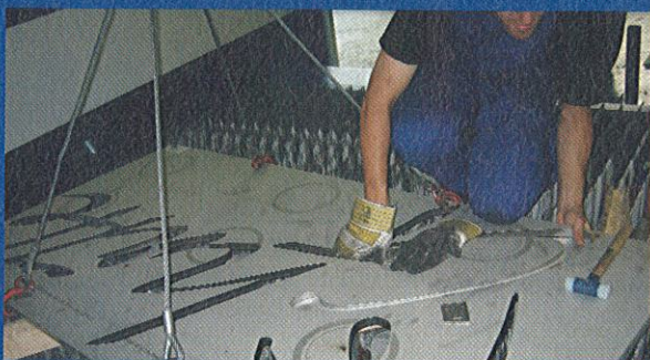
... gestaltet von der ...