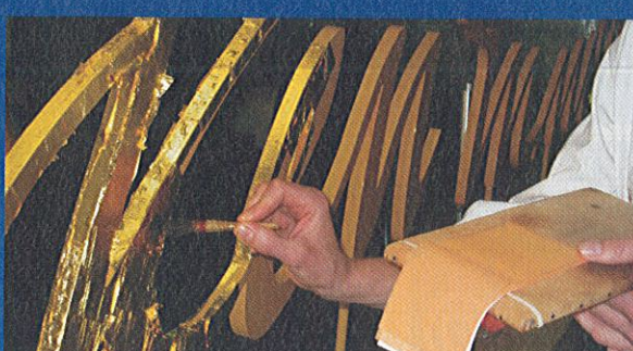
... das Kloster St. Anton